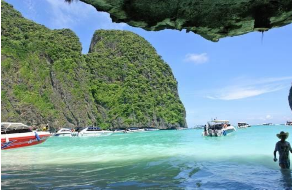
ภาพที่ 2.16 ชายหาดที่อ่าวมาหยา จังหวัดกระบี่ การท่องเที่ยวเชิงนิเวศทางทะเล