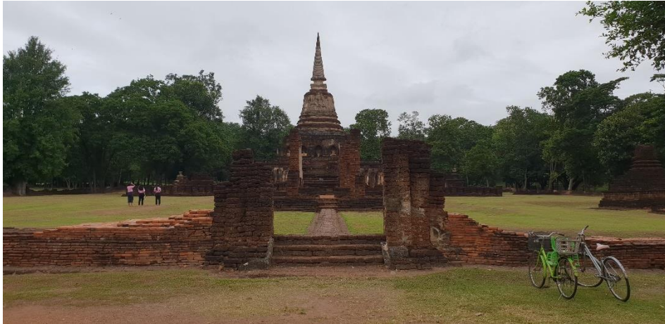
ภาพที่ 2.7 เจดีย์วัดช้างล้อม จังหวัดสุโขทัย เป็นแหล่งท่องเที่ยวทางประวัติศาสตร์