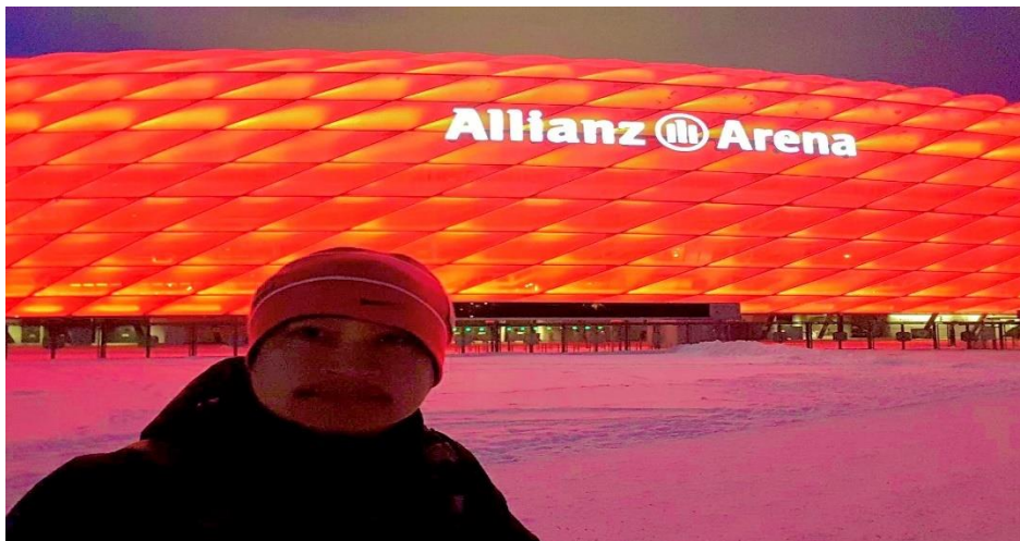
ภาพที่ 2.8 การเข้าชมสนามกีฬาที่มีความยิ่งใหญ่และชมการแข่งขันคือการท่องเที่ยวเพื่อนันทนาการ

5. การท่องเที่ยวเพื่อนันทนาการ (Recreational Attraction) หมายถึง แหล่งท่องเที่ยวที่มนุษย์สร้างขึ้น เพื่อการพักผ่อนและเสริมสร้างสุขภาพ ให้ความสนุกสนาน รื่นรมย์ บันเทิง และการศึกษาหาความรู้ แม้ไม่มีความสำคัญในแง่ประวัติศาสตร์ โบราณคดี ศาสนา ศิลปวัฒนธรรม แต่มีลักษณะเป็นแหล่งท่องเที่ยวร่วมสมัย ตัวอย่างเช่น ย่านบันเทิงหรือสถานบันเทิง สวนสัตว์ สวนสนุกและสวนสาธารณะลักษณะพิเศษ สวนสาธารณะและสนามกีฬา