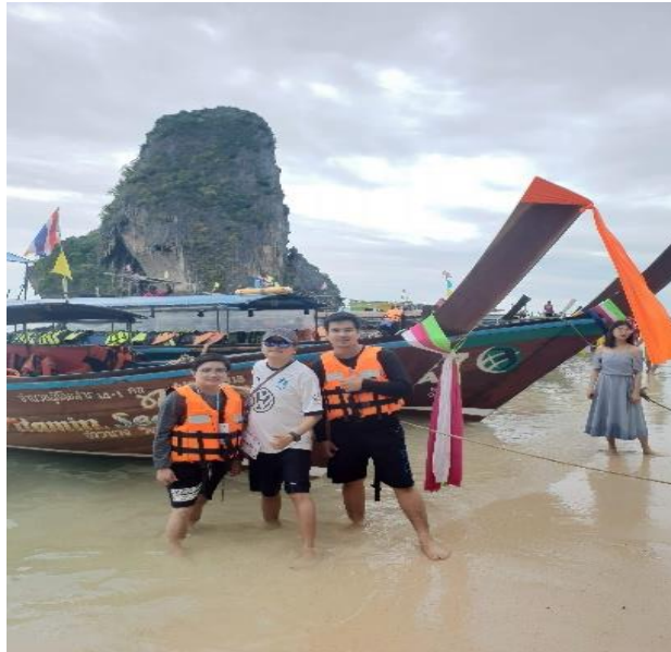
ภาพที่ 2.11 การเข้าชมความสวยงามของชายหาดไร่เลย์จังหวัดกระบี่ที่ชื่อเสียงไปทั่วโลกเป็นลักษณะของการท่องเที่ยวประเภทชายหาด