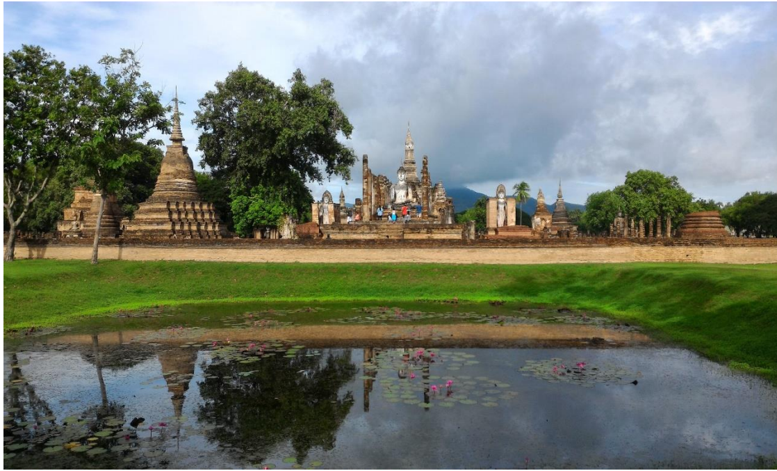
ภาพที่ 2.17 วัดมหาธาตุ อุทยานประวัติศาสตร์สุโขทัย จังหวัดสุโขทัย เป็นรูปแบบการท่องเที่ยวทั้งเชิงประวัติศาสตร์ และวัฒนธรรมและประเพณี