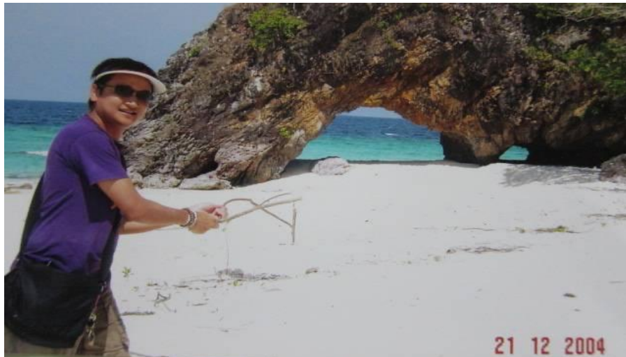
ภาพที่ 2.13 เกาะไข่ จังหวัดสตูล การท่องเที่ยวทางธรรมชาติประเภทเกาะ

11. การท่องเที่ยวทางธรรมชาติประเภทเกาะ (Island Attraction) เป็นประเภทของการท่องเที่ยวที่มีความสำคัญกับองค์ประกอบคุณค่าด้านการท่องเที่ยวและความ เสี่ยงต่อการถูกทำลายมากที่สุด เนื่องจากเป็น แรงดึงดูดใจสำคัญสำหรับให้นักท่องเที่ยวเข้าไปเที่ยวชมแหล่ง ท่องเที่ยวประเภทหมู่เกาะนี้ เพราะจัดว่าเป็น ประเภทของแหล่งท่องเที่ยวอันดับต้น ๆ ที่นักท่องเที่ยวมีความต้องการเดินทางไป