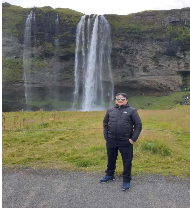
ภาพที่ 2.12 น้ำตก Seljalandsfoss ประเทศไอซ์แลนด์ เป็นน้ำตกหนึ่งที่มีความสวยงามมากที่สุดในโลก