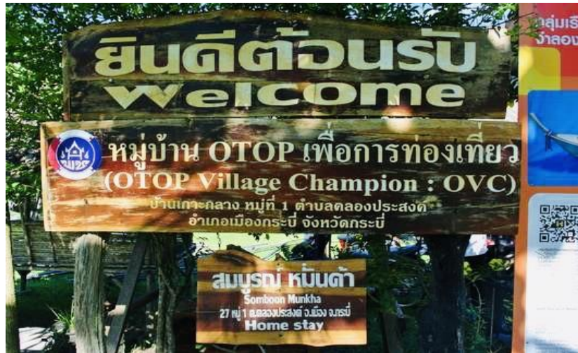
ภาพที่ 2.19 โฮมสเตย์บ้านเกาะกลางจังหวัดกระบี่