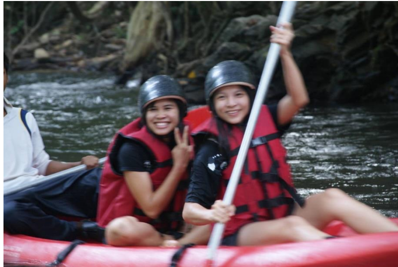
ภาพที่ 2.14 นักท่องเที่ยวล่องแก่งวังสายทอง จังหวัดสตูลการท่องเที่ยวทางธรรมชาติประเภทแก่ง

ในปัจจุบันรูปแบบของอุตสาหกรรมท่องเที่ยวและบริการนั้นมีการพัฒนาและเปลี่ยนแปลงไปเป็นอย่างมาก ด้วยเนื่องจากหลาย ๆ เหตุปัจจัยที่ทำให้อุตสาหกรรมท่องเที่ยวและบริการมีประเภทและรูปแบบใหม่เกิดขึ้น ซึ่งก็เป็นผลดีต่อกลุ่มนักท่องเที่ยวที่จะมีช่องทาง หรือทางเลือกใหม่ ๆ ในการที่จะเลือกใช้บริการทางการท่องเที่ยวและบริการในปัจจุบันนี้ โดยสามารถแบ่งรูปแบบการท่องเที่ยวและบริการในยุคสมัยใหม่ได้เป็นประเภทต่าง ๆ ดังนี้