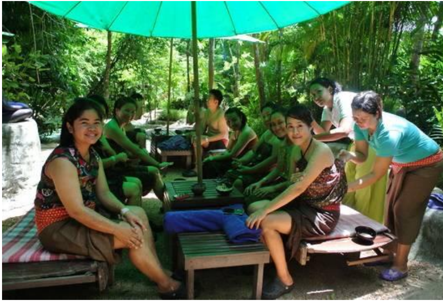
ภาพที่ 2.18 นักท่องเที่ยวกำลังทำสปาที่น้ำตกร้อนวาริรัก จังหวัดกระบี่